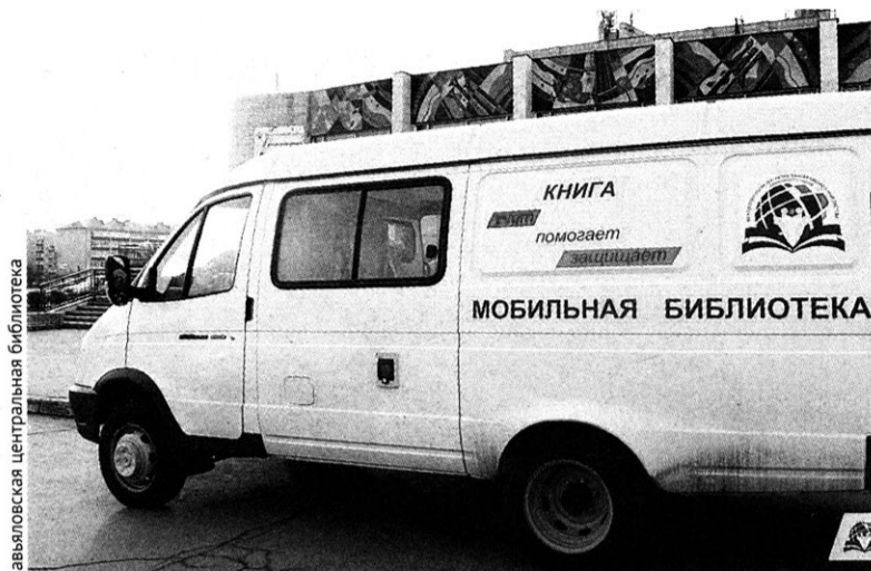
Завьяловская центральная библиотека

Библиотекари выезжают четыре раза в неделю, в каждой деревне работают 1-1,5 часа. Библиобус может остановиться в любом месте, возле клуба, школы, детского сада, но самое оптимальное место - стоянка у магазина. Книжный шкаф в машине заполнен до отказа - книгами по различным темам и журналами, у читателей должен быть выбор.